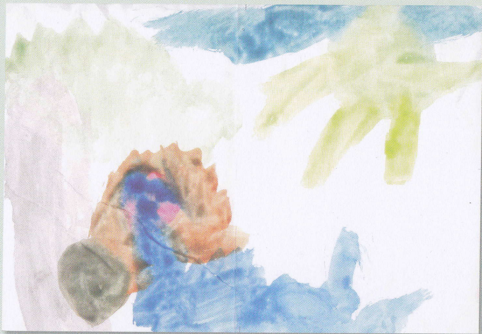
FIGURA 2 Luca, de 3 ani și 3 luni, a ales tehnica acuarelelor, care tinde să favorizeze culorile pale, dezvăluind astfel o profundă sensibilitate și o înclinație înnăscută spre retragerea în momentele plăcute de liniște, susținut și de un tată capabil să-i insuflă energie din nou.